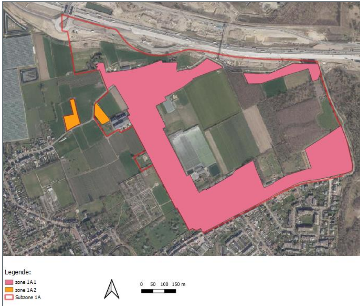
Tabel 5.3 Gebruikte oppervlaktes in de vuilvrachtberekening