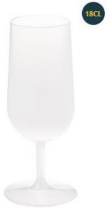
Beker op voet 18cl