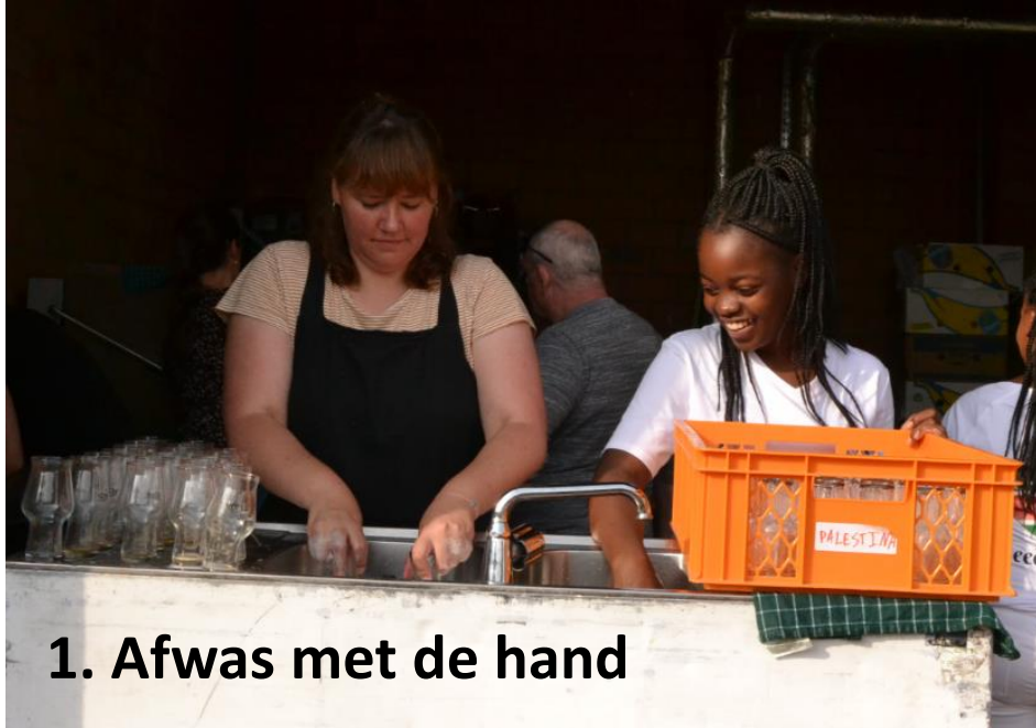
1. Afwas met de hand