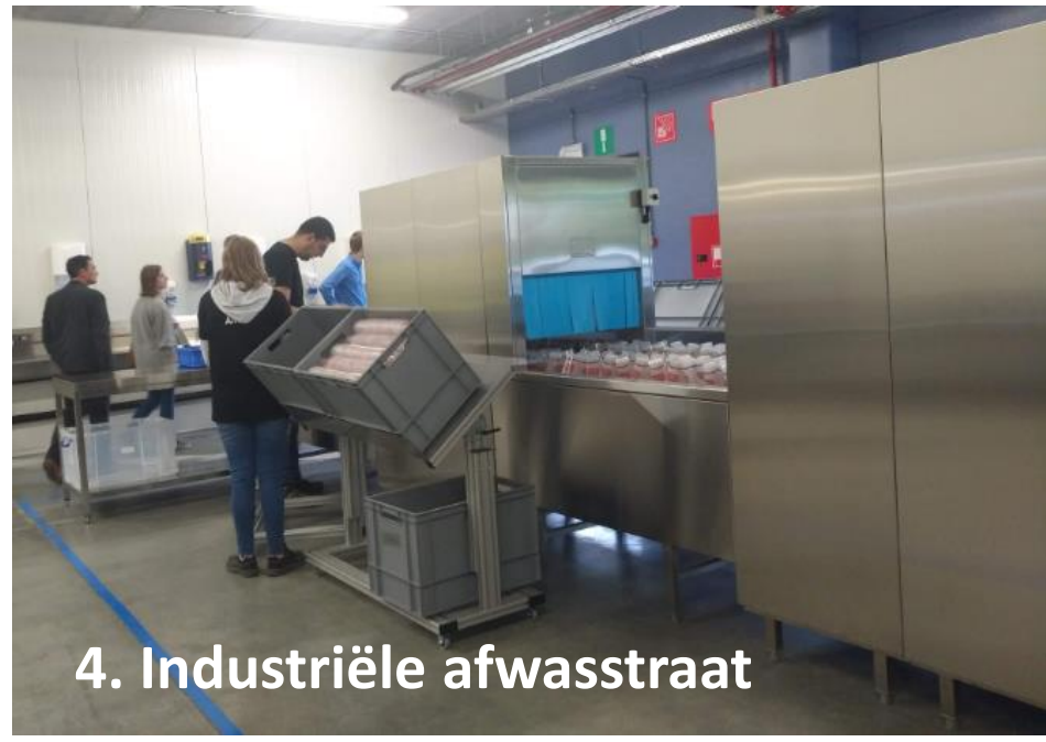
4. Industriële afwasstraat