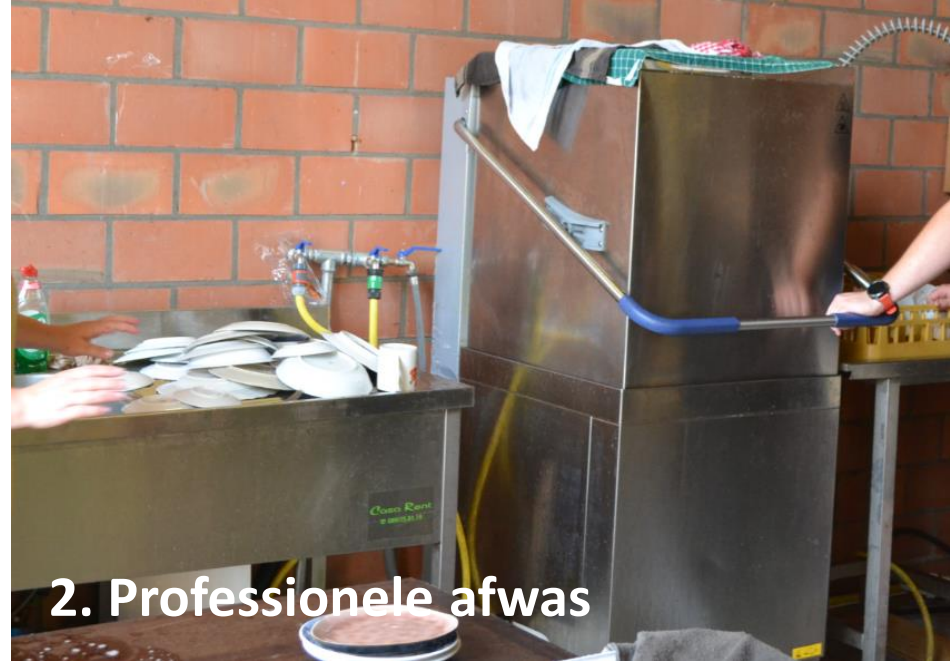
2. Professionele afwas