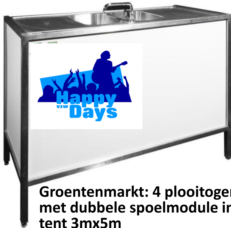
Groentenmarkt: 4 plooitogen met dubbele spoelmodule in tent 3mx5m