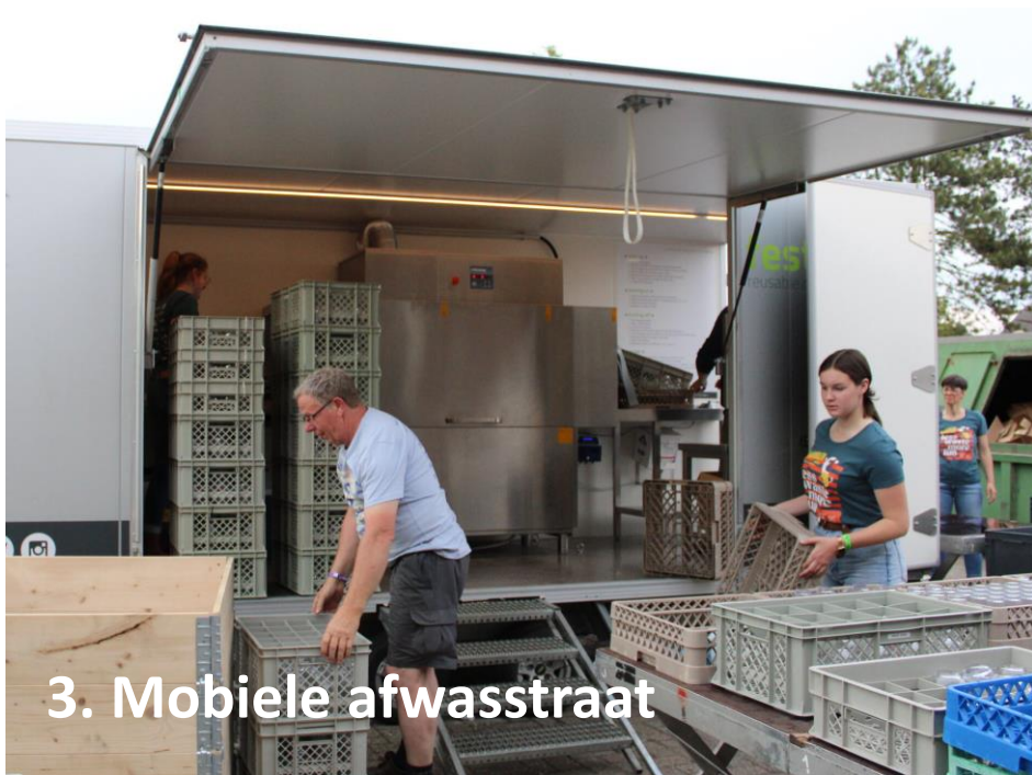
3. Mobiele afwasstraat