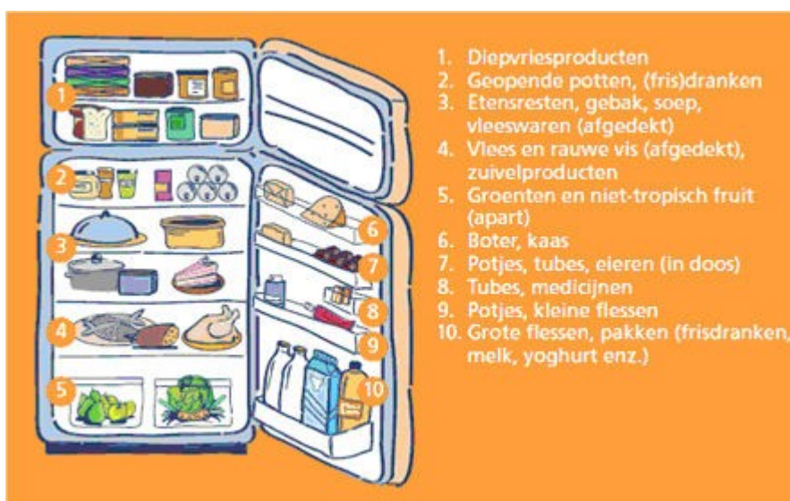
Figuur 4: De ideale indeling van de koelkast. www.voedingscentrum.nl

Een boodschappenlijstje kan helpen impulsieve aankopen, die tot 70% van de boodschappen kunnen uitmaken, tegen te gaan. Ook het nagaan van de aanwezige voorraden in de kasten en frigo voorkomt overbodige aankopen. Als men de aangepaste portiegrootte voor de maaltijden van de gezinsleden kent, voorkomt men dat er restjes overblijven op de borden. De houdbaarheidsdatum wordt best gecheckt in de winkel omdat het soms voorkomt dat er vervallen producten op de rekken blijven liggen. Hoe beter de koudeketen wordt gerespecteerd, hoe langer de gekoelde en diepgevroren producten goed blijven. Hierbij worden deze producten best het laatst gekocht en bewaard in een geïsoleerde zak. Terug thuis worden deze best zo snel mogelijk in de frigo geplaatst in de aangepaste zone. Een frigo is namelijk niet overal even koud. De producten die eerst zijn aangekocht, zouden eerst opgebruikt moeten worden. Bereide voedingswaren moeten opgegeten, gekoeld of diepgevroren worden binnen twee uur (één uur bij warm weer). Hierna is de bacteriële groei te ver gevorderd om de maaltijd nog op te kunnen eten. Verdere typische hygiëne regels helpen natuurlijk ook om het bederven van voedsel tegen te gaan.