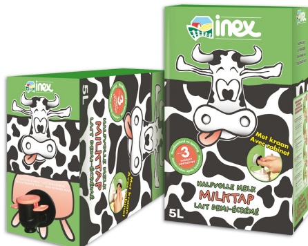
Figuur 2: De milktap, bron: nv Inex

Steeds meer verpakkingen kunnen na opening terug gesloten worden, zodat er een betere portionering is en het overblijvende voedsel beter beschermd blijft. Verder is er een trend in Europa om verpakkingen van verschillende volumes aan te bieden, zodat zowel grote als kleine gezinnen aan hun trekken komen. Een voorbeeld van zo een doseringsverpakking is de Bag-in-Box (BIB). Het product, bvb melk, wordt aseptisch in een plastic zak verpakt, afgesloten met een tapkraantje. Via dit kraantje kan geen lucht binnendringen, zodat de melk langer vers blijft, zelfs na opening.